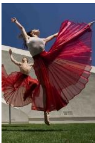
Un momento del balletto

I nove danzatori preferiscono l'uso del triangolo e del disegno circolare, restituendo la solennità del balletto accademico, sia in coppia sia nei gruppi che dispongono la scena. Il "pas de deux" sdraiato è una celebrazione da paradiso perduto, celebrativo e a tratti aulico nel celebrare l'avvenenza fisica. "City", del 2010,