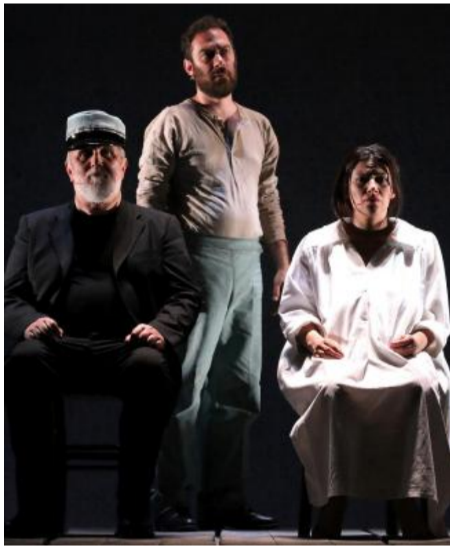
Moni Ovadia (a sinistra) durante lo spettacolo

sima sinfonia di parlate, una meravigliosa sicilitudine linguistica, fatta di neologismi, di sintassi travestita, di modi d'uso mutuati dal dialetto che esaltano la recitazione degli attori. Al debutto nazionale al 59mo Festival dei Due Mondi di Spoleto, nel giugno 2016, il pubblico ha applaudito con calore la compagnia e Moni Ovadia, disinvoltato nel passare dal ruolo centrale di narratore a ruoli secondari come la buffa "mammana", del giudice e del barbiere. L'attore torna a Schio dopo "Es Iz Amerika". Biglietti platea 1° settore: intero 25 euro, ridotto 21. Platea 2° settore: intero 22; ridotto 19. Galleria intero 15, ridotto 13. ●