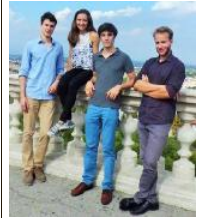
Il "Quartetto Berico"