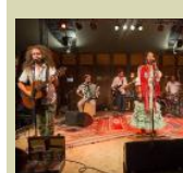
Il gruppo Ajde Zora