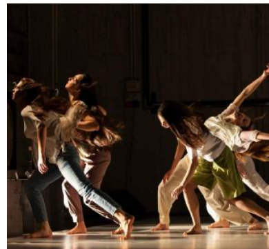
Alcuni momenti dello spettacolo "Le quattro stagioni"

Nelle note di regia la compagnia spiega i diversi approcci che hanno portato alla realizzazione del balletto: "L'Estate è femminile, rappresenta il nostro attaccamento alla realtà sensuale del mondo, è una sorta di languida quiete dopo la tempesta. L'Autunno invece