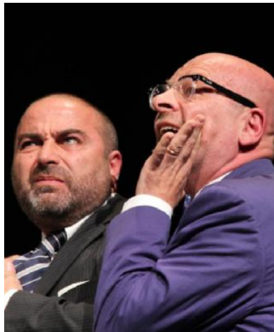
"Il metodo Gronholm" della compagnia bolognese "I Complici"