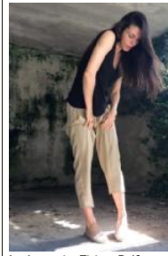
La danzatrice Tiziana Bolfe

Anteprima di Hybrid della Bolfe oggi a Schio