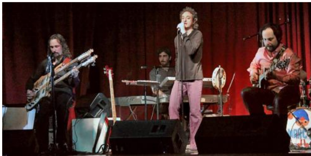
I The Watch saranno questa sera sul palco dell'auditorium Vivaldi di San Giuseppe di Cassola

L'Auditorium Vivaldi di San Giuseppe di Cassola ospita oggi alle 21, il concerto dei The Watch, una delle migliori tribute band dei Genesis in circolazione, che porterà la propria ultima produzione, intitolata "Yellow show". La formazione ripercorrerà non solo il periodo dell'album "Nursery crime" dei Genesis, album pubblicato nel 1971, ma anche alcuni brani da "A trick of the tail" e "Wind & wuthering", entrambi del 1976, in una maniera particolare, ovvero come se il cantante storico della formazione, Peter Gabriel, non avesse mai lasciato i Genesis prima della pubblicazione di questi due dischi. Inoltre, in scaletta non mancheranno alcuni dei cavalli di battaglia dei Wa-