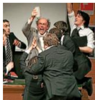
Lo spettacolo dell'Elfo